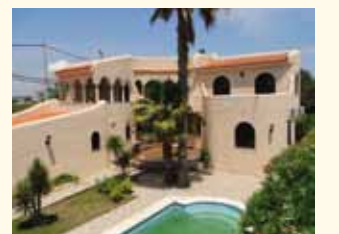
SPANJE - Costa del Azahar Costa Azahar Pagina 105