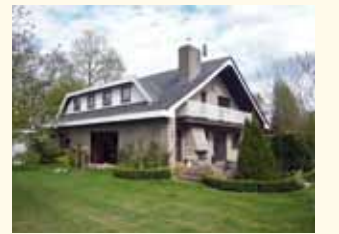
DUITSLAND - Emsland Span Intermakelaars Pagina 45