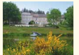
FRANKRIJK - Ardèche Payet Immobilier Pagina 79