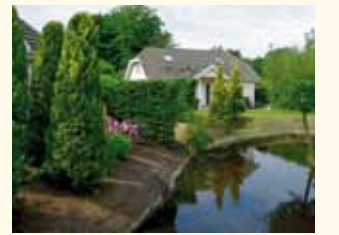
NEDERLAND - Flevoland Wevers Home Makelaardij O.G. Pagina 16