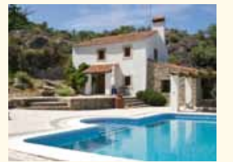
PORTUGAL - Alentejo Wevers Home Makelaardij O.G. Pagina 99